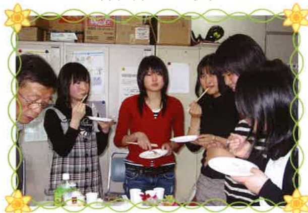
帰国のお祝いに駆けつけてくれた、おじいちゃん友達