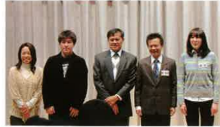
日本語スピーチコンテスト発表者