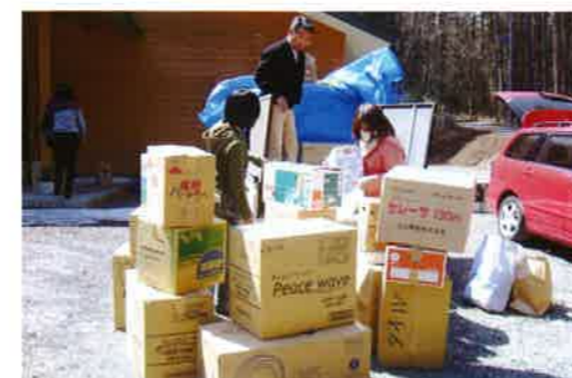
運び込まれた義援物資

りました。実は、当初皆さんにお願いをして集めた物の一部が、直前になり「キッズキャンプ」に於いて過剰だと知らされ協会に保留としました。確かに、現地へ行ってみると、山のように古着が部屋いっぱいありました。(キャンプは、4月初めの時点では、まだ受け入れ体制が整っていませんでしたが、現在ではしっかりした体制が出来ているとのことでした。)残された物資は、市役所を通し、必要といただく被災者へお届けしています。今後とも、ご協力よろしく申し上げます。