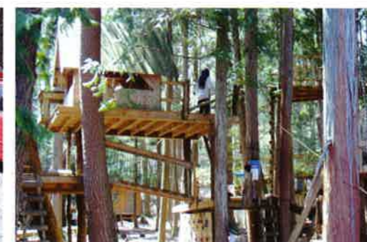
大自然の中の「キッズキャンプ」