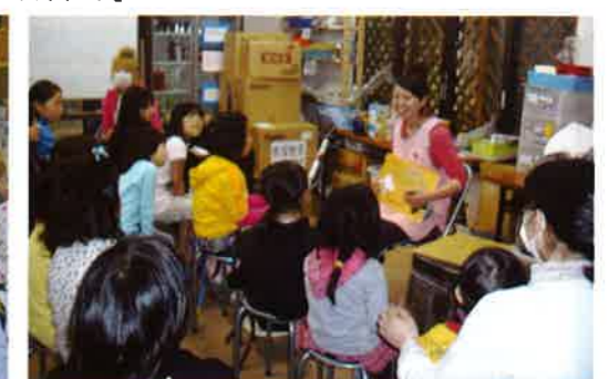
被災地から避難してきた子供たち